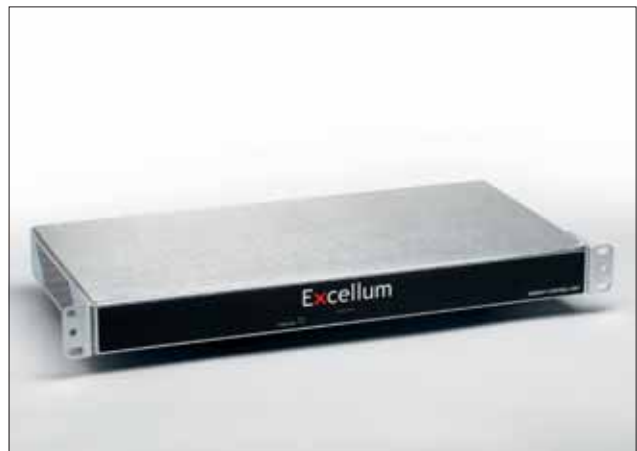
Excellum regelt de verlichting op gebouwniveau en optimaliseert het globale energieverbruik.