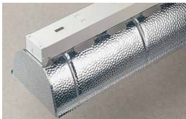
Door uplightsleuven ontstaat een gerichte luchtcirculatie die storende stofafzetting op de reflector voorkomt.