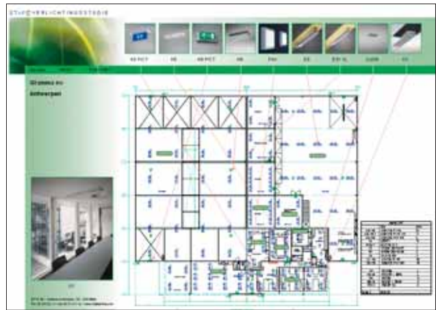
Een doordacht verlichtingsontwerp bepaalt voor elke werkomgeving de meest energiezuinige verlichtingsoplossing.