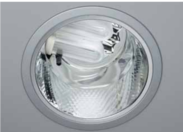
Met lichtregelsystemen als ELS wordt het kunstlicht gedimd in functie van het daglicht. Op die manier wordt energie bespaard per individuele armatuur.