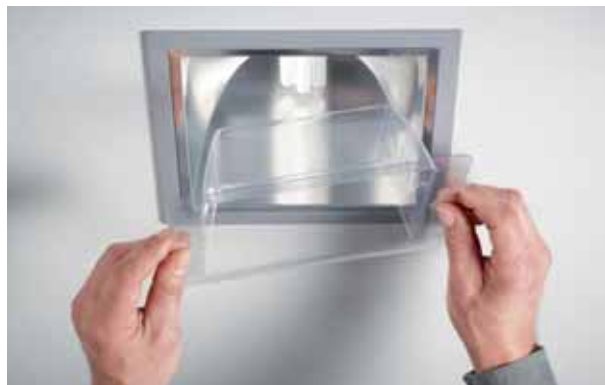
Bescherming tegen bouwstof.

Het gevaar bestaat dat bij berekeningen verkeerde vergelijkingen tussen fabrikanten gemaakt worden door verschil in aannames betreffende de behoudfactor. ETAP, Philips, Zumtobel Staff en Osram hebben daarom een rapport laten opstellen door een onafhankelijk wetenschappelijk instituut over het bepalen van de behoudfactor. In dit rapport staan factoren voor bepaalde types vervuiling, types armaturen, ... Dit resulteert in de onderstaande tabel die toepasbaar is voor aluminium reflectorarmaturen met elektronisch voorschakelapparaat in een op regelmatige basis gereinigde ruimte. Bij de groepsvervang van de lampen wordt er van uitgegaan dat de omgeving en de armaturen grondig worden gereinigd.