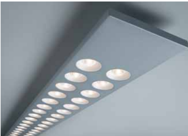
ETAP besteedt veel zorg aan de energiezuinigheid van zijn armaturen. Uitgekiende lenzen, reflectoren en diffusoren leiden tot een optimale lichtverdeling.

Ook het gebruik van daglicht wordt in de norm aanbevolen: het zorgt immers voor variabiliteit in de omgeving (door de wijzigingen in niveau en spectrale samenstelling) en het kan bijdragen tot een goede 3D-weergave van objecten. Bovendien appreciëren de meeste mensen visueel contact met de buitenwereld. Door het gebruik van een daglichtregelsysteem kan de energiezuinigheid van verlichting uiteraard in de hand gewerkt worden.