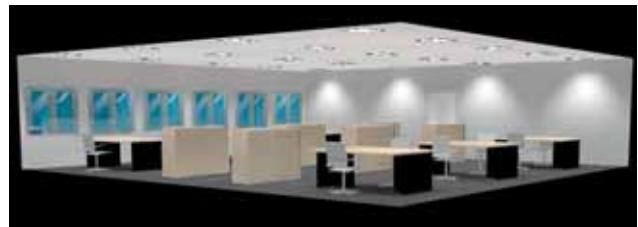
Studie kantoor met U7-armaturen. Muren: \bar{E}_m = 241 \text{ lx} en U_o = 0,38 Plafond: \bar{E}_m = 141 en U_o = 0,55

\bar{E}_m > 75 \text{ lx} voor muren en \bar{E}_m > 50 \text{ lx} voor plafonds.